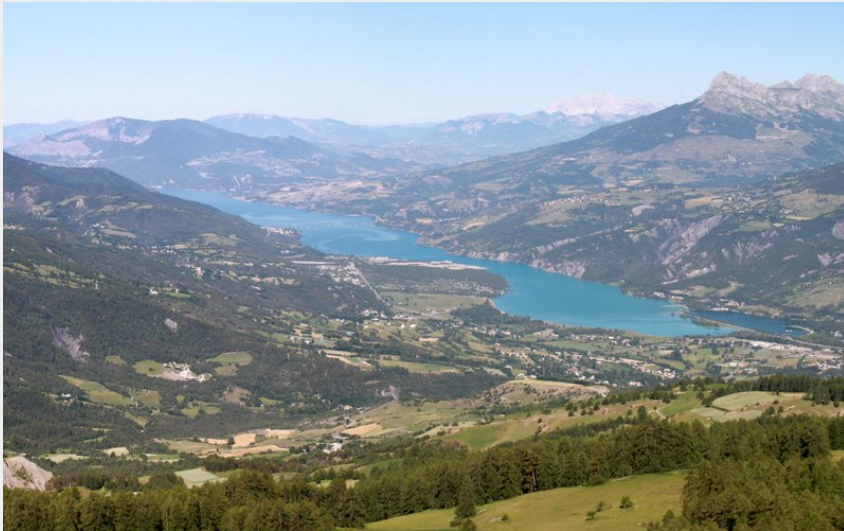
Vue sur le lac de Serre-Ponçon