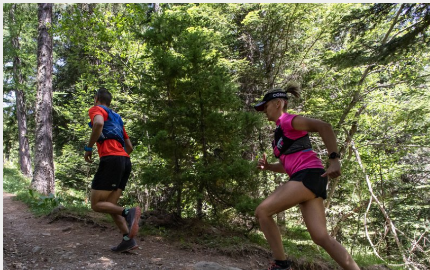
le petit bois