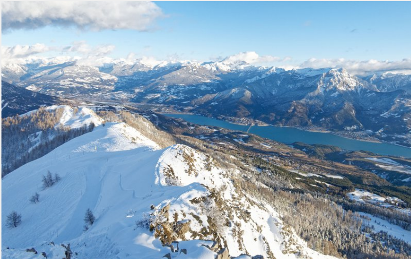
Lac de Serre-Ponçon (Lucien Mariotte)