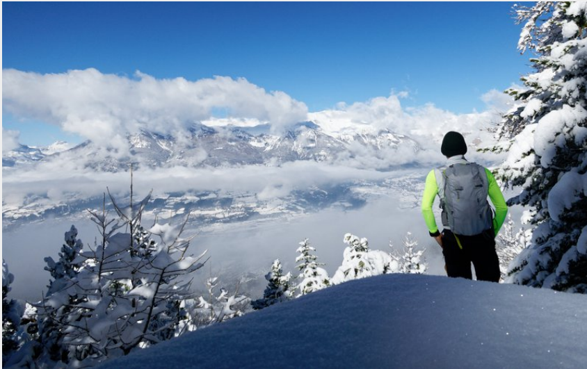
Belvédère de Bajoulan (Lucien Mariotte)