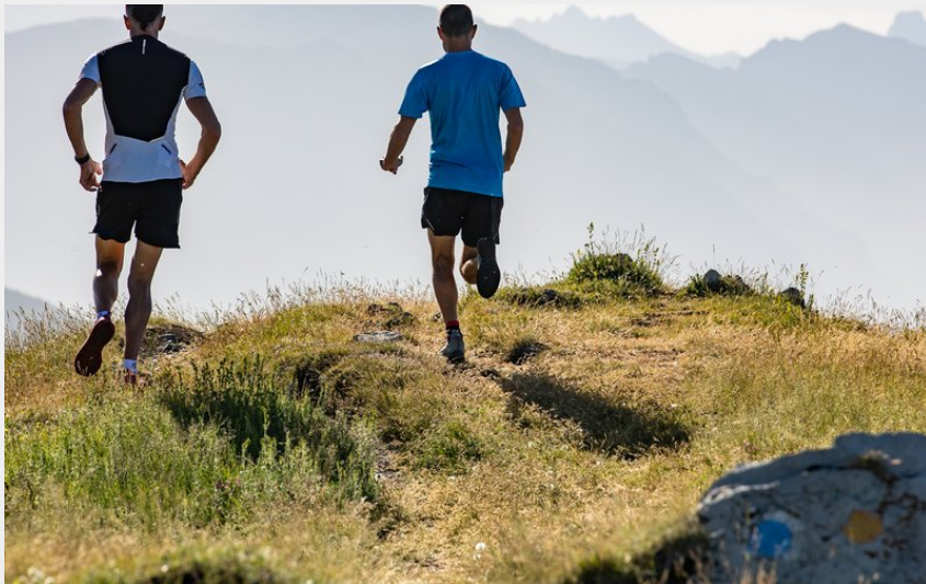
Trail Chorges