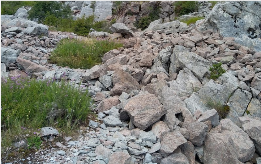
Carrière de Salados (Etienne Charles)