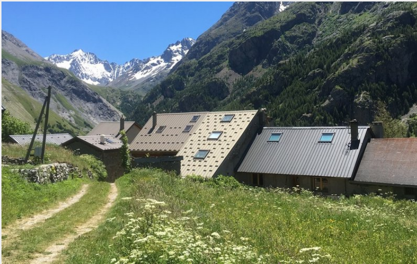
Tour des hameaux de Villar d'Arêne