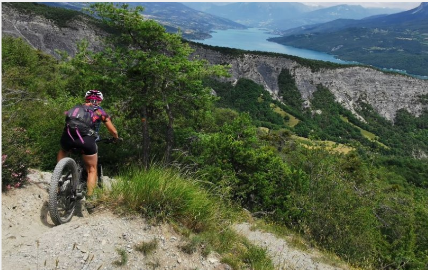
Descente sur le lac - sentier monotrace (Parc national Ecrins - E-Pedal)