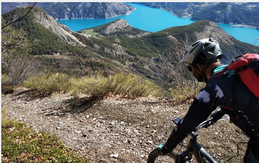
Vue sur le Sauze-du-Lac depuis les hauteurs de Rousset (Parc national des Ecrins - Emmanuel Danjou)