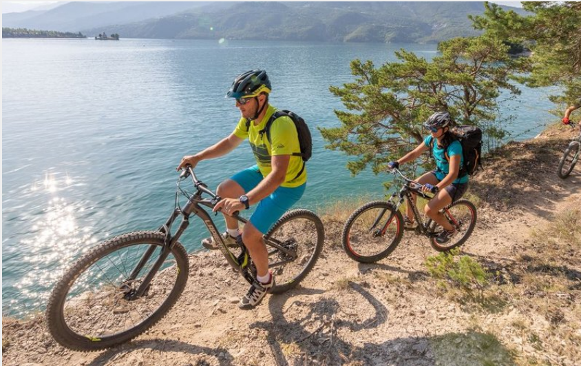
VTT Baie St-Michel