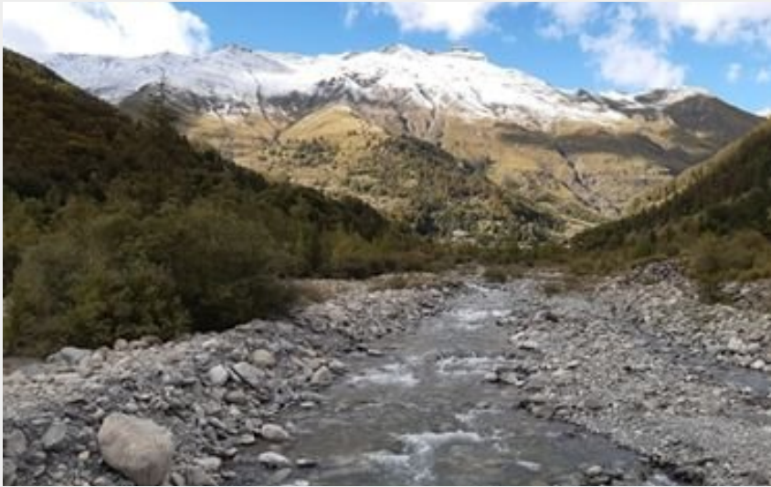
le torrent de Réallon (florimont.tilliere)