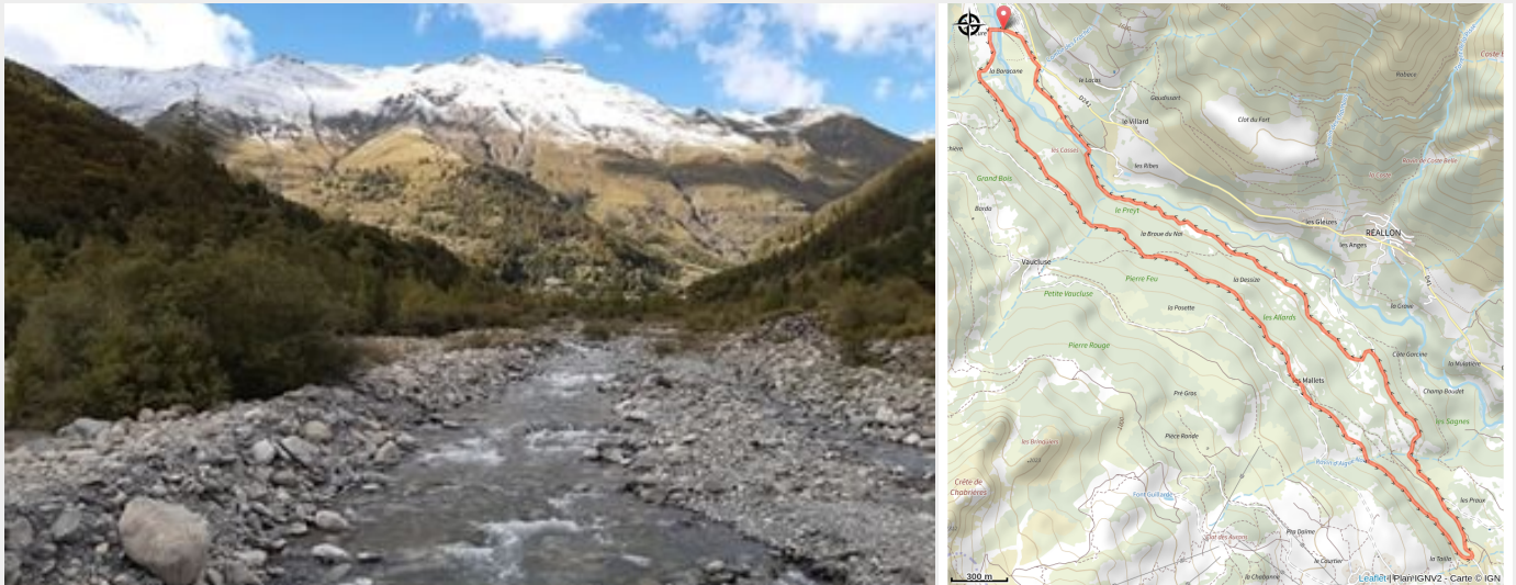
le torrent de Réallon (florimont.tilliere)

Un percorso molto facile che si snoda intorno al torrente Réallon.