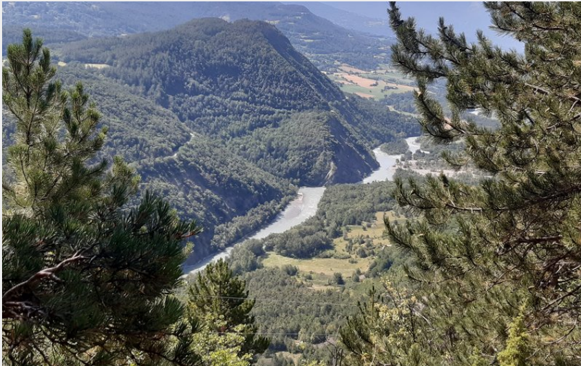
La vallée de la Durance (florimont.tilliere)