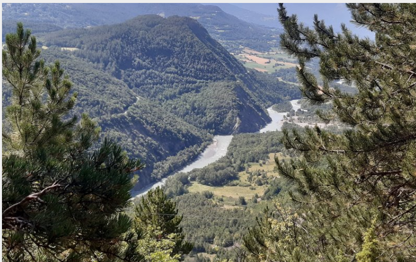
La vallée de la Durance (florimont.tilliere)