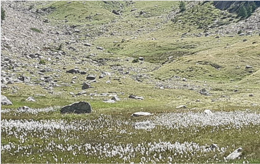
champ de linaigrettes (florimont.tilliere)