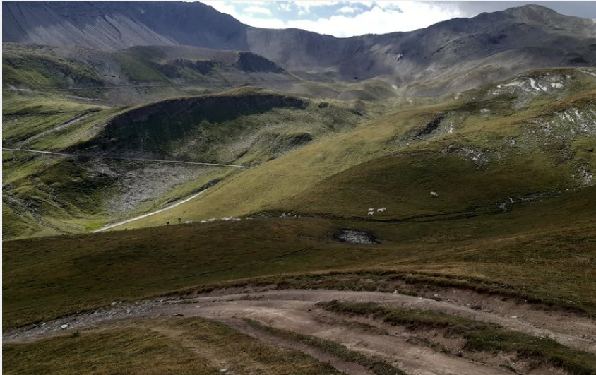
Col du Parpaillon en arrière plan (florimont.tilliere)