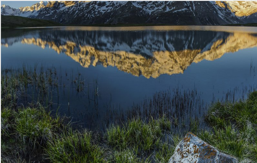
Lever de soleil au lac du Pontet