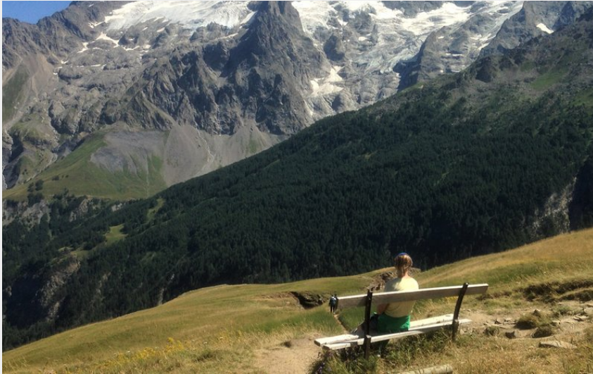
Banc avec vue sur la Meije (J. Selberg)