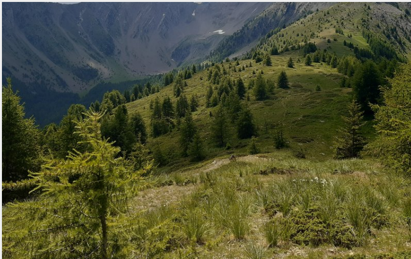
Sur la crête du Lauzet