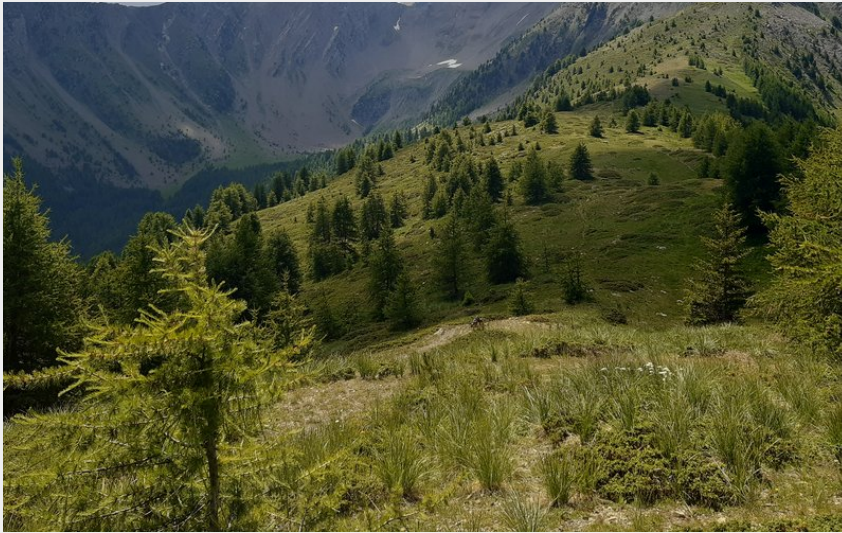
Sur la crête du Lauzet