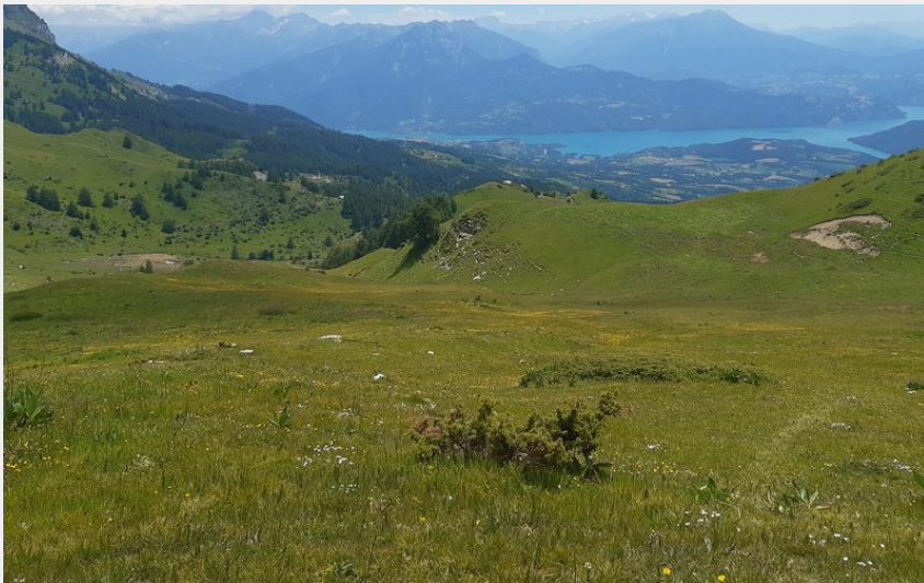
Alpages sous le col (florimont.tilliere)