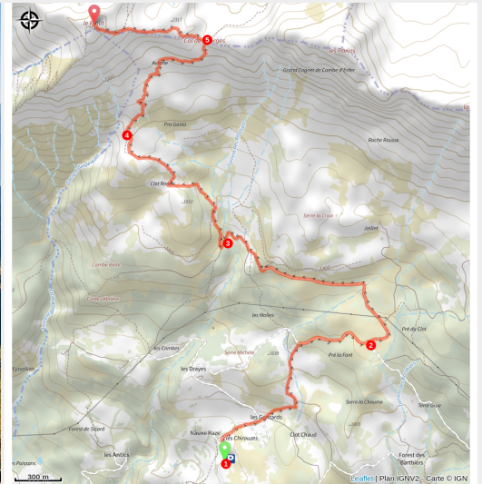
Sommet du Piolit (Rémi Morel)

Si tratta di un'escursione impegnativa che vi condurrà attraverso i pascoli montani colorati che portano a Le Piolit.