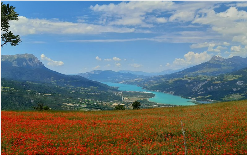
Champ de coquelicots surplombant le lac (florimont.tilliere)