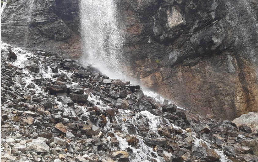
Les sources de Jérusalem (florimont.tilliere)