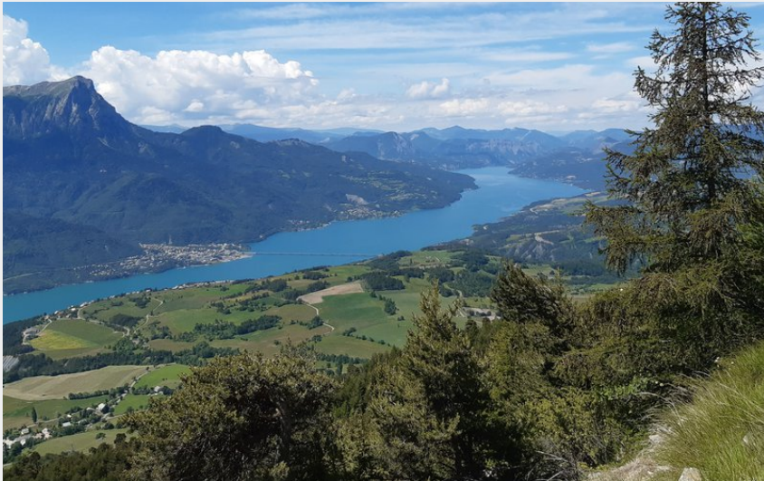
Vue depuis le belvédère de Para (florimont.tilliere)