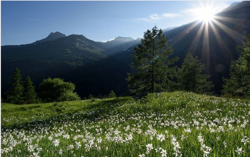
Sentier de l'Oussella