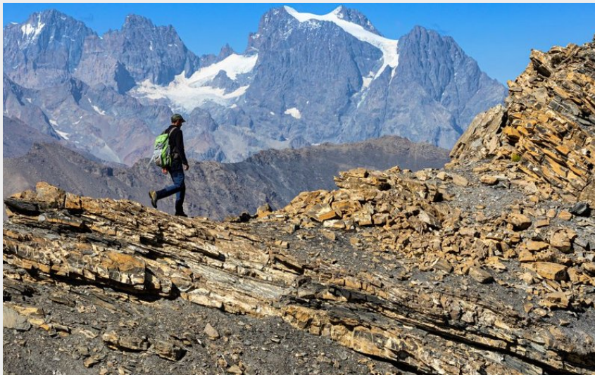
Randonneur à la Tête de Vautisse