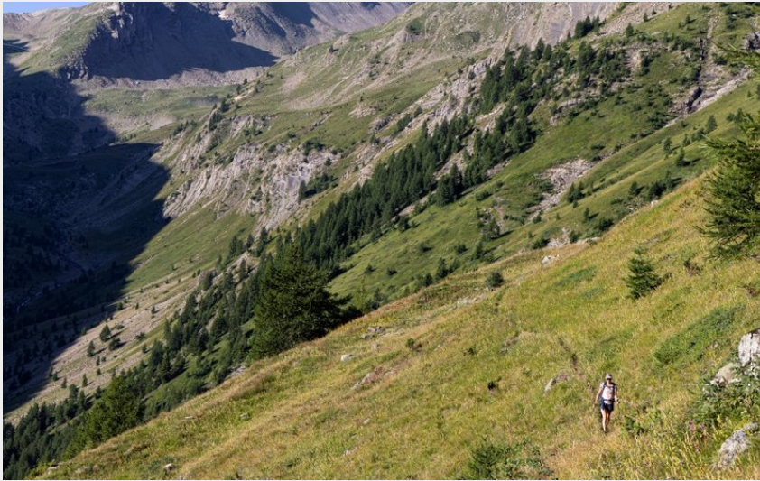
Montée au col des Tourettes