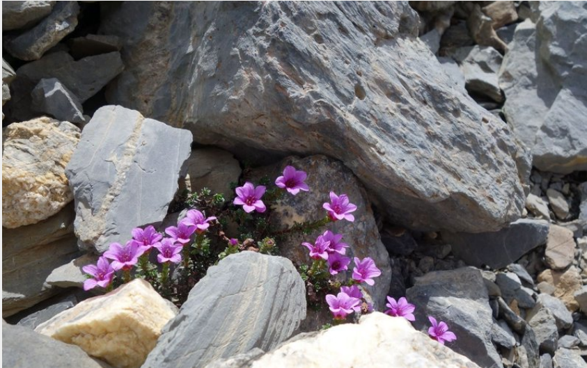
saxifrage à feuilles opposées