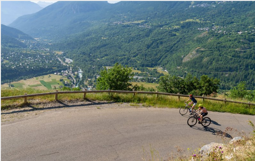
Montée à Puy Aillaud (Rogier Van Rijn)