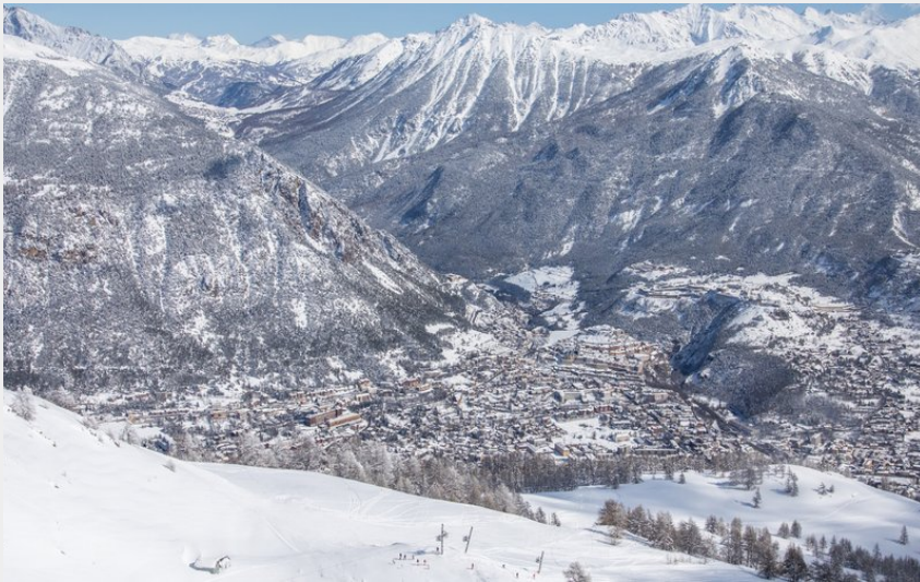
Vue sur Briançon depuis le Prorel