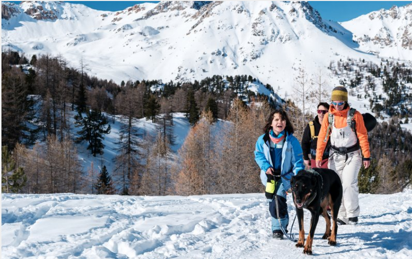
Montée au col de l'Izoard