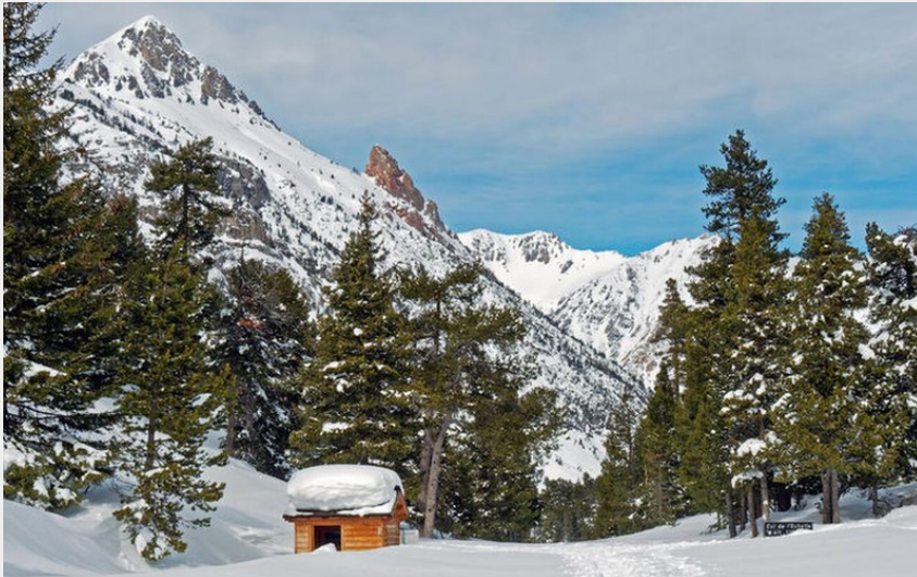
Col de l'Echelle