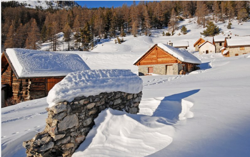
Les chalets des Acles en hiver