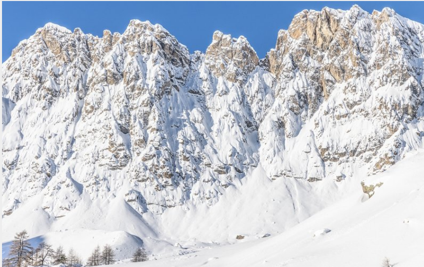
Crêtes au dessus du refuge de Buffère