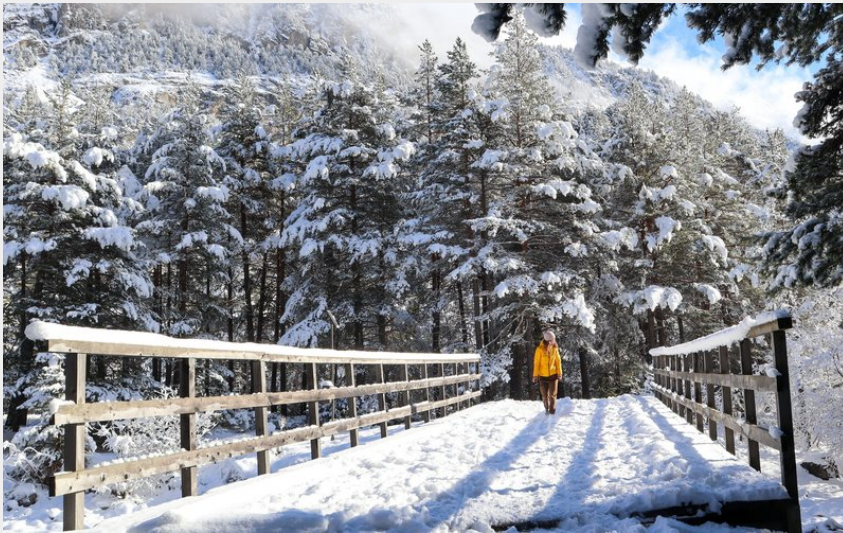
Pont avant Plampinet