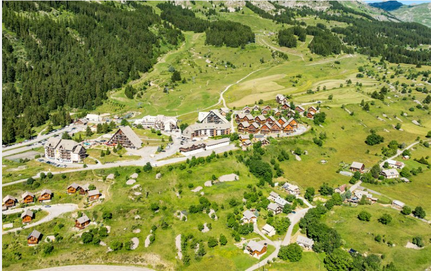
(Rémi morel - Serre-Ponçon)