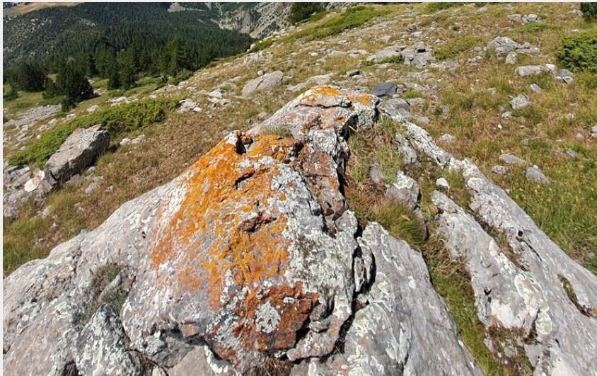
Vue depuis le sommet du KV