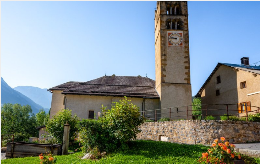
Val des Prés