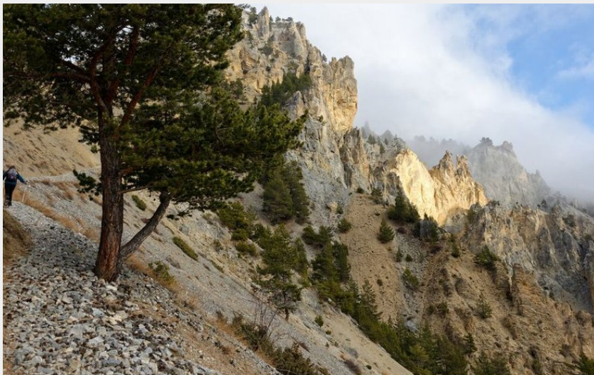
Boucle Roche Moutte