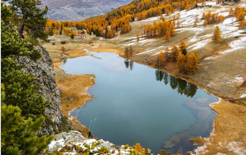
Lac des Chiens