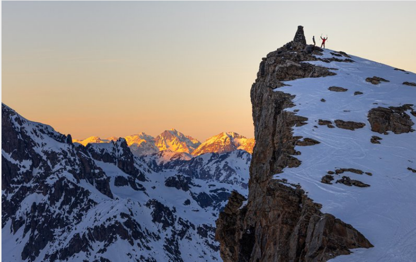
Sommet de la Blanche (PNE)