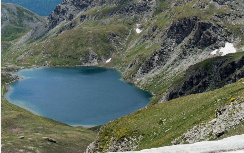
Lac et Col de Malrif