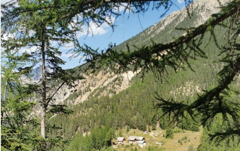
Chalets du Vallon