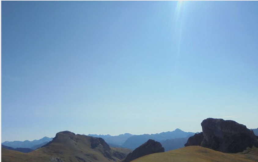
Col de la Pisse - Puy Saint André