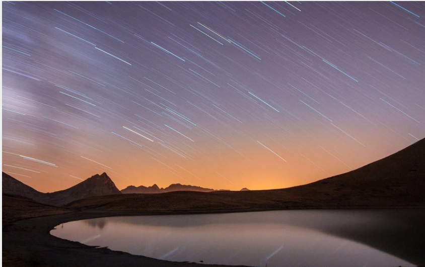
Lac Gignoux de nuit