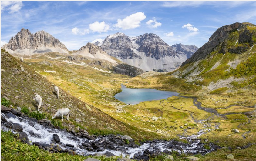
Lac Lavoir