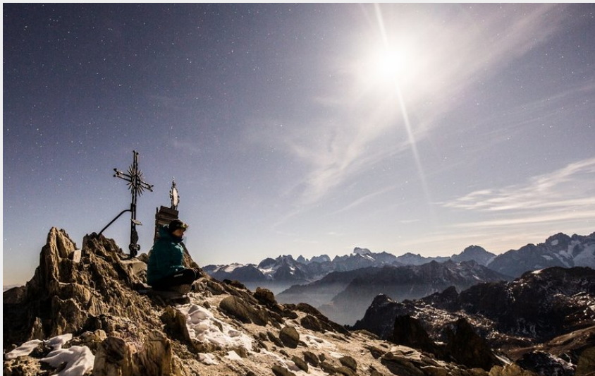
Pointe des Cerces Névache