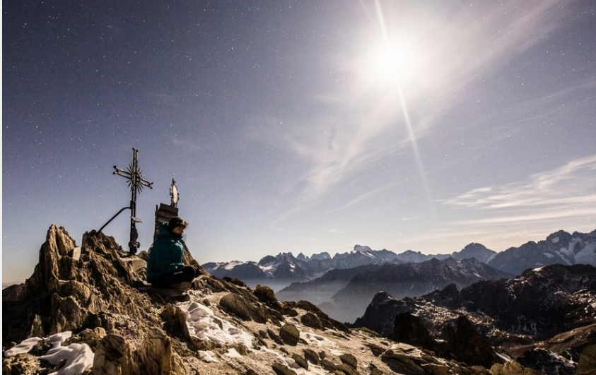
Pointe des Cerces Névache