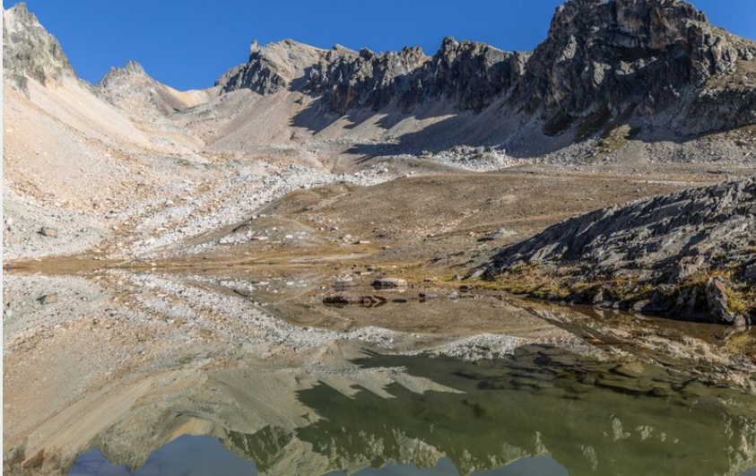
Mont Thabor