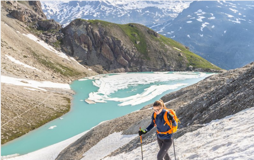
Lac Beraudes Clarée Névéche