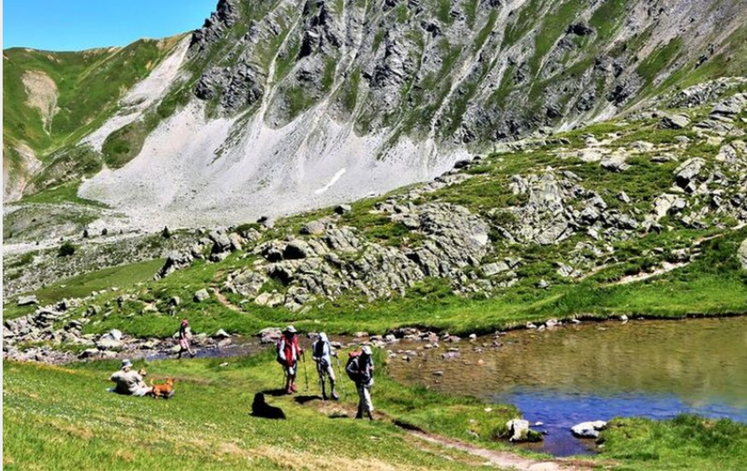
Grand Lac de l'Oule